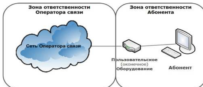
СХЕМА ВКЛЮЧЕНИЯ ПОЛЬЗОВАТЕЛЬСКОГО (ОКОНЕЧНОГО) ОБОРУДОВАНИЯ ПО ТЕХНОЛОГИИ WNGN