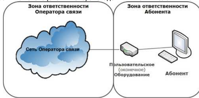
СХЕМА ВКЛЮЧЕНИЯ ПОЛЬЗОВАТЕЛЬСКОГО (ОКОНЕЧНОГО) ОБОРУДОВАНИЯ ПО ТЕХНОЛОГИИ WNGN