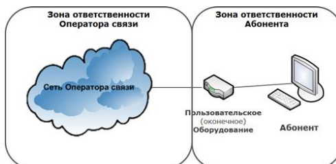
СХЕМА ВКЛЮЧЕНИЯ ПОЛЬЗОВАТЕЛЬСКОГО (ОКОНЕЧНОГО) ОБОРУДОВАНИЯ ПО ТЕХНОЛОГИИ WNGN