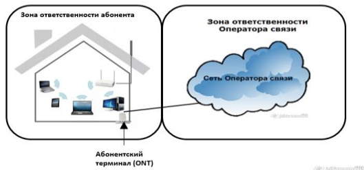
СХЕМА ВКЛЮЧЕНИЯ ПОЛЬЗОВАТЕЛЬСКОГО (ОКОНЕЧНОГО) ОБОРУДОВАНИЯ ПО ТЕХНОЛОГИИ xPON