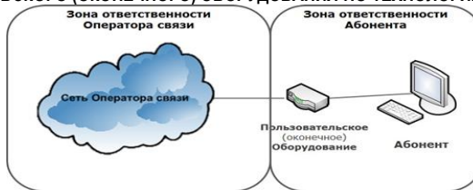
СХЕМА ВКЛЮЧЕНИЯ ПОЛЬЗОВАТЕЛЬСКОГО (ОКОНЕЧНОГО) ОБОРУДОВАНИЯ ПО ТЕХНОЛОГИИ WNGN