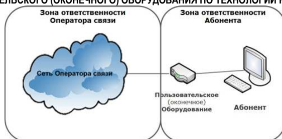
СХЕМА ВКЛЮЧЕНИЯ ПОЛЬЗОВАТЕЛЬСКОГО (ОКОНЕЧНОГО) ОБОРУДОВАНИЯ ПО ТЕХНОЛОГИИ WNGN