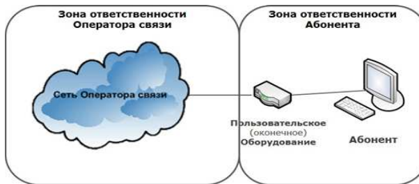
СХЕМА ВКЛЮЧЕНИЯ ПОЛЬЗОВАТЕЛЬСКОГО (ОКОНЕЧНОГО) ОБОРУДОВАНИЯ ПО ТЕХНОЛОГИИ WNGN