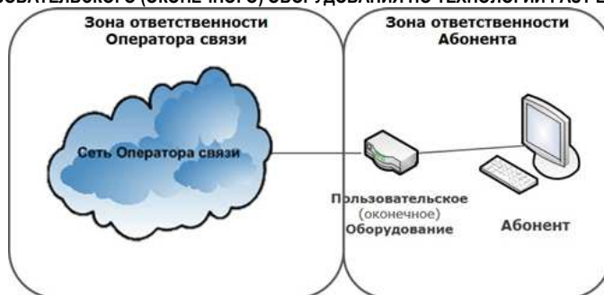
СХЕМА ВКЛЮЧЕНИЯ ПОЛЬЗОВАТЕЛЬСКОГО (ОКОНЕЧНОГО) ОБОРУДОВАНИЯ ПО ТЕХНОЛОГИИ WNGN