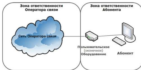
СХЕМА ВКЛЮЧЕНИЯ ПОЛЬЗОВАТЕЛЬСКОГО (ОКОНЕЧНОГО) ОБОРУДОВАНИЯ ПО ТЕХНОЛОГИИ WNGN