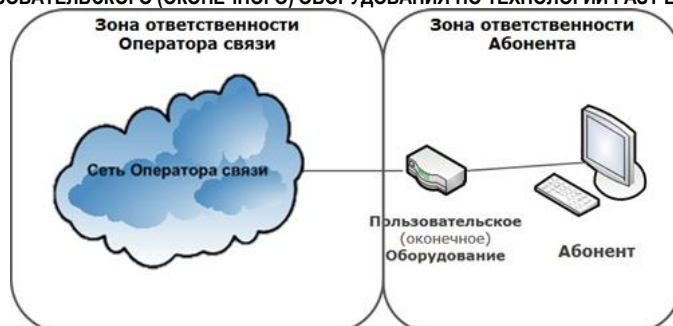
СХЕМА ВКЛЮЧЕНИЯ ПОЛЬЗОВАТЕЛЬСКОГО (ОКОНЕЧНОГО) ОБОРУДОВАНИЯ ПО ТЕХНОЛОГИИ WNGN